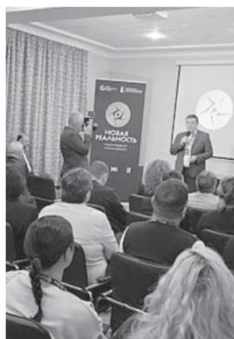
Организаторы форума - Союз журна-